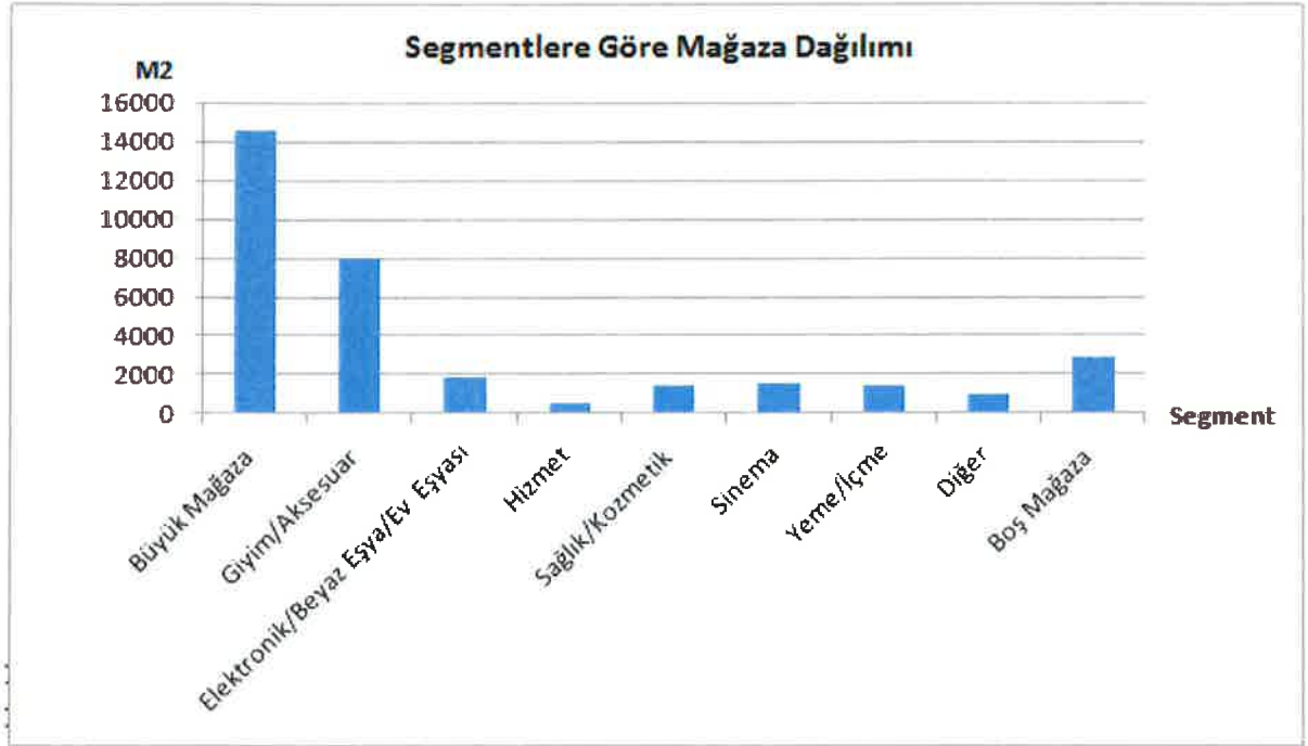
AVM bünyesindeki mağazaların kategorilere göre alansal dağılımı